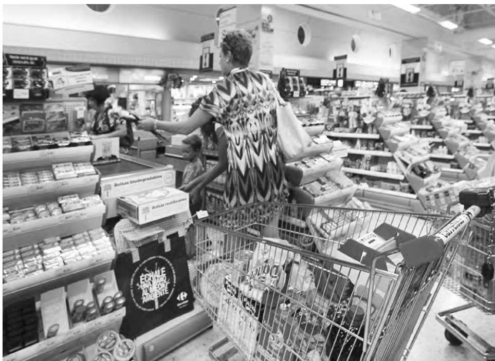
Facua recomienda a los consumidores que tomen sus decisiones basándose en el precio y la calidad. J. NAVAS

asciende a 0,83 euros en el caso de Asturiana, entre 0,86 y 0,94 euros en el de Pascual y entre 0,78 y 0,83 en el de Puleva. Si opta por ellas, el consumidor pagará hasta un